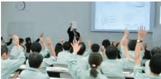
知財イベント（第15回発明の日）

モノづくりの原点は現場にあります。新卒の新入社員（技術職）は、当社グループの工場実習があり製品の組み立てや検査を行います。製造現場の人々と接点を持ちながら、長年にわたって培われてきた技術・技能と“モノづくりへのこだわり”という価値観を共有する人財に成長することを期待しています。